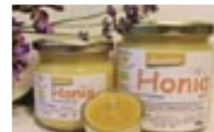
Honig direkt vom Kernzhof