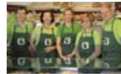
Das Team des Biodelikat Bad Tölz