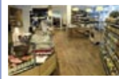
Im Alpenbiomarkt Bad Tölz