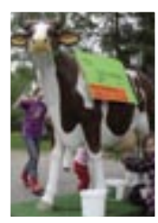
Gestaltete und echte Kühe vom Stollhof