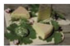
Der Assenhauer Hof und sein Käse