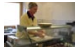
Qualitätsprodukte vom Ziegenhof