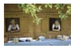
Das Team vom Waldhauser-Hof