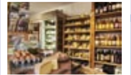
Einkaufen auf dem Schmied-Hof