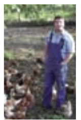
Auf dem Thoma-Hof